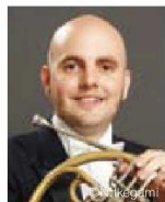
ジョナサン・ハミル